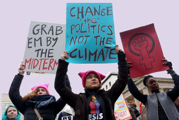
Womens March in Duitsland, 2017

Op 8 maart gaan wereldwijd miljoenen vrouwen de straat op. Voor een bevrijde vrouw in een bevrijde maatschappij. Het is een uiting van internationale verbondenheid van vrouwen.