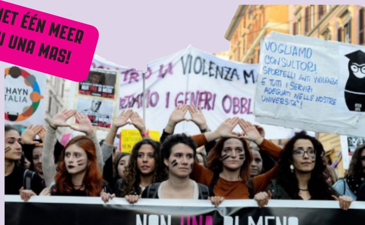
Vrouwenstaking in Napels, 2017