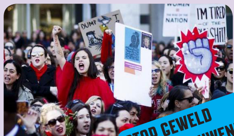
New York, 2017

in Rusland en aan de baanbrekende successen voor de bevrijding van de vrouw in het socialisme werd in 1921 besloten om Internationale Vrouwendag in het vervolg altijd op 8 maart te vieren.