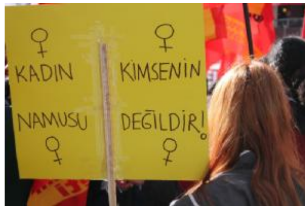
زن ناموس کسی نیست

در کنار گروه ها و تشکلات مختلف، برخی از خانواده های زنان کشته شده و قربانیان خشونت جنسی دیده می شد، همچنان که عکس قربانیان را با خود حمل کرده، خواستار اتمام خشونت علیه زنان بودند و بعضا رو به دولت ترکیه شعار های مخالفت سر می دادند. برخی از مقامات دولتی ترکیه مانند بسیاری از برادران خود در دولت های ارتجاعی دیگر، در پی افزایش خشونت و کشته شدن زنان و اعتراضات سرداده نسبت به آن، اعلام داشته بودند که زنان خود مسبب همچین جنایاتی هستند؛ و علت را رعایت نکردن اموری که به "بنیان های خانواده" آسیب وارد می کند، دانستند. دولت "عدالت و توسعه ی اسلامی" همان گونه که همواره بر خانواده تاکید داشته سعی در معرفی اسلام به عنوان الگوی خیر و آسایش فردی و اجتماعی داشته است؛ اما در روز هشت مارس زنانی محجبه نیز دیده می شد. یکی از این زنان که خواهرش چندی پیش کشته شده و قاتل نیز مشخص بود، از تریبون گروهی کمونیستی و دانشجویان مارکسیست استفاده کرد تا اعلام کند که ما به خاطر