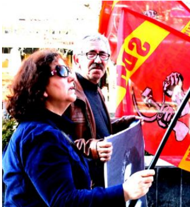
S.D.H (جنبش انقلاب مداوم: surekli devrim hareketi)

در این روز از احزاب مختلف سوسیالیست، مارکسیست و کمونیست گرفته تا تشکل های دانشجویی، گروه های فمینیستی و افراد مستقل حضور داشتند که مانند اغلب راهپیمایی ها و اعتراضات، در محدوده ی محله ی کیزیلا ی به یکدیگر پیوسته و چندین میدان، از جمله میدان ساکاریای را پیموده و در مکان هایی در همان محدوده توقف کرده و شعار های خود را سر دادند. ساعت حضور از حدود دوازده ظهر تا پنج عصر بود اما به طور جدی تر و رسمی تر برنامه ها در بین ساعت دو تا چهار پیش رفتند؛ البته برخی از گروه های فمینیستی راهپیمایی زنان بدون ورود مردان را پیش بردند و شعار هایی با مضامینی چون: "زنان، زندگی، آزادی"، "شورش از خانه"، و... را در راهپیمایی خود سرداده و برخی راهپیمایی هایی در شب هشت مارس داشتند.