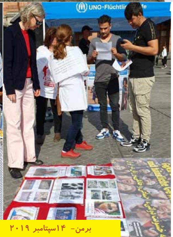
برمن - ۱۴ سپتامبر ۲۰۱۹