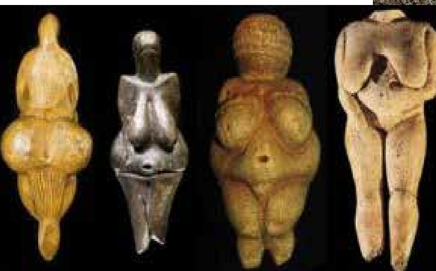
مجسمه های ونوس، ۱۰۰۰۰ تا ۳۰۰۰۰ هزار سال پیش از میلاد، اروپا