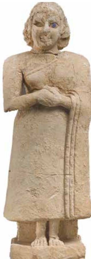
تمدن سومر، ۲۶۰۰ تا ۲۵۰۰ پیش از میلاد