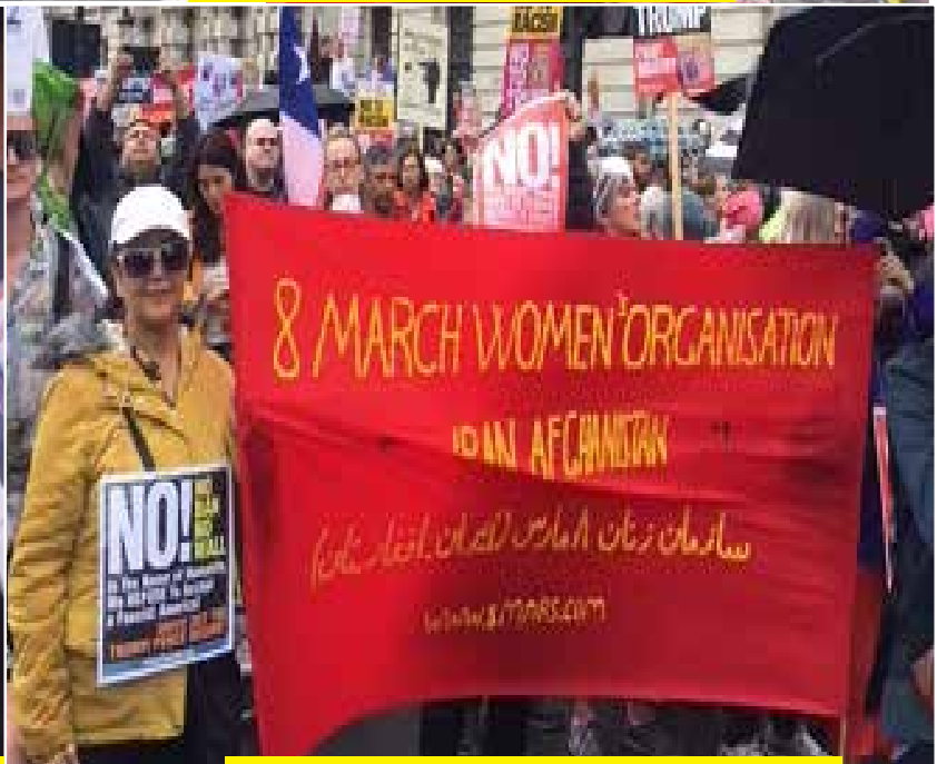
شرکت در تظاهرات ضد ترامپ / ۵ ژوئن ۲۰۱۹ - لندن