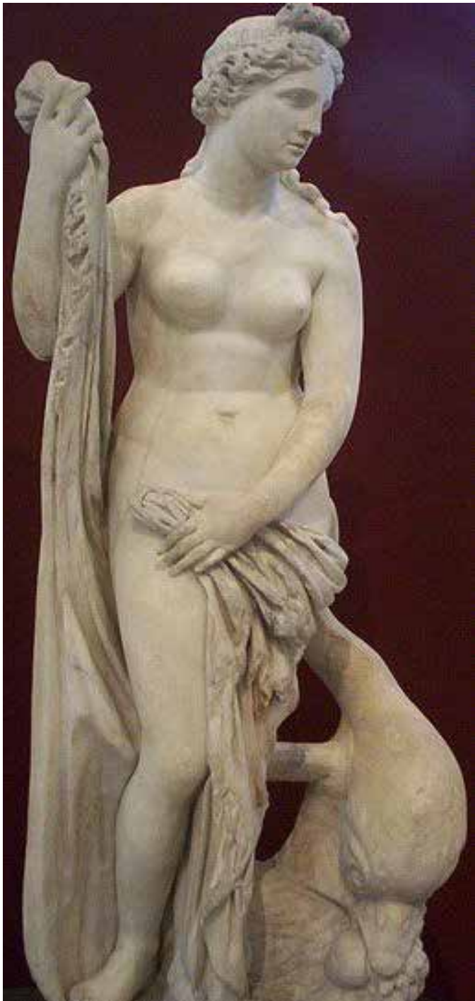
ونوس میلو، یونان باستان، ۱۰۰ تا ۱۳۰ قبل از میلاد