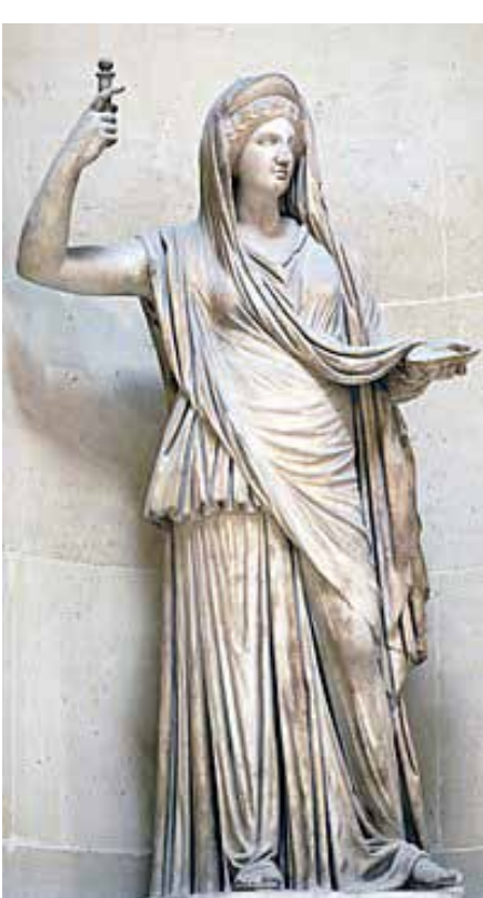
هرا: ایزدبانوی زایمان، خانواده، ازدواج در اساطیر یونان باستان) و شاید منشاء تندیس های مریم مقدس

در ارتباط با نحوه ی پوشش زنان سومری، با رجوع به تندیس های کشف شده، طیف مختلفی را می توان مورد بررسی قرار داد. گاهی پیراهن ها چین بر چین اند و چند انگشتی بالاتر از مچ پا (قد پیراهن ها به حدی است که کاملا امکان حرکات آزادانه فراهم باشد) هستند که با توجه به فیگور غالب در این پوشش، تکیه بر تخت داشتن زن، می توانسته ناشی از قدرت سیاسی و نظامی وی نیز باشد. گاه