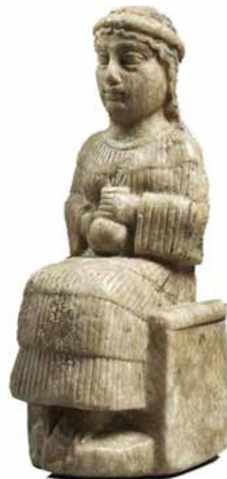
زن نشسته بر تخت. تمدن سومر

در تمدن عیلام هنوز زنانی توانسته‌اند به مقام امپراتوری برسند، هنوز میزان قدرتی در دست و پوششی راحت داشته‌اند. اما در فاصله ای نه چندان طولانی که تمدن عیلام به دست کوروش هخامنشی (وارثان هنر و تمدن آشور) نابود شد و در دوران حاکمیت این سلسله، زن به «کَتک بانو»