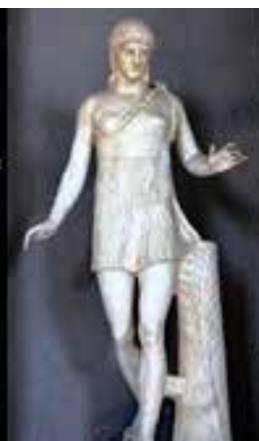
تندیس هایی از زنان اسپارتی در تمدن یونان باستان