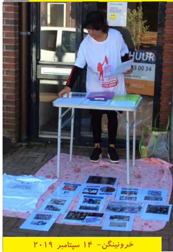
خرونینگن - ۱۴ سپتامبر ۲۰۱۹