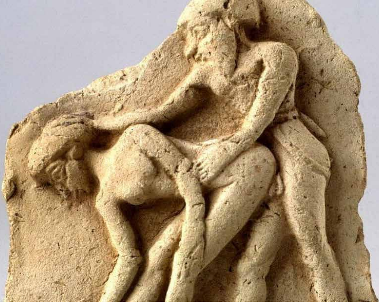
هزاره ی دوم پیش از میلاد. تمدن بابل