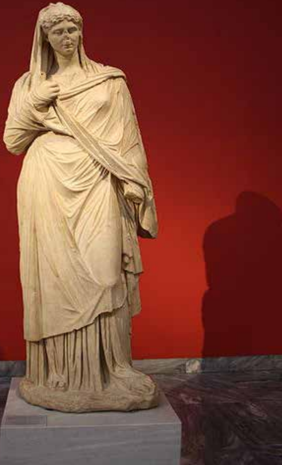
تندیس زن آتنی در سده ی چهارم پیش از میلاد

در هنر بابل مطابق با کلیت آن دوران، گاهی تمثیل هایی از ایزدبانوان مادر نیز دیده می شود اما برخلاف آن حجم عریان سکسیتی در نموده های دیگر این هنر، اغلب آثار مربوط به ایزدبانوان، به صورت پر لباس و پوشیده با کودکی در اغوش ترسیم شده اند.