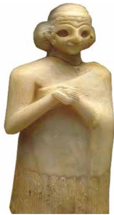
زن نیایشگر سومری