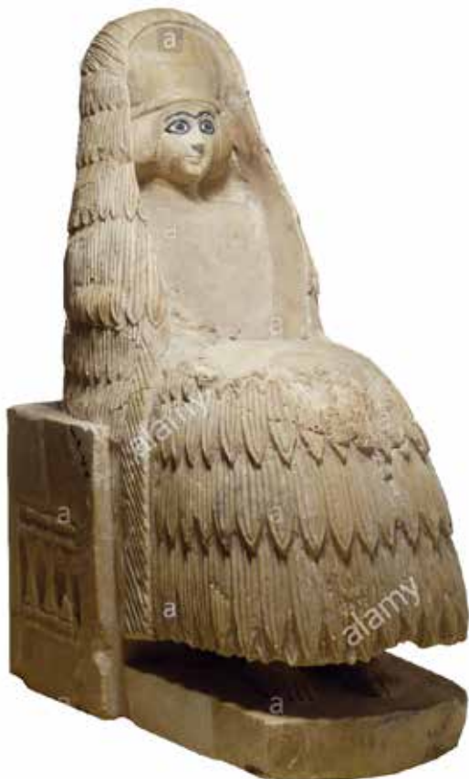
تمدن سومر، ۲۴۶۰ پیش از میلاد