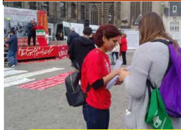
آمستردام - ۷ سپتامبر ۲۰۱۹

برای مطالعه ی نسخه ی کامل این گزارشات می توانید به سایت سازمان زنان هشت مارس مراجعه نمایید.