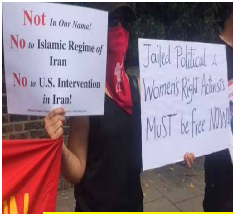
مقابل سفارت جمهوری اسلامی در لندن در دفاع از زندانیان سیاسی ۴ ژوئن ۲۰۱۹