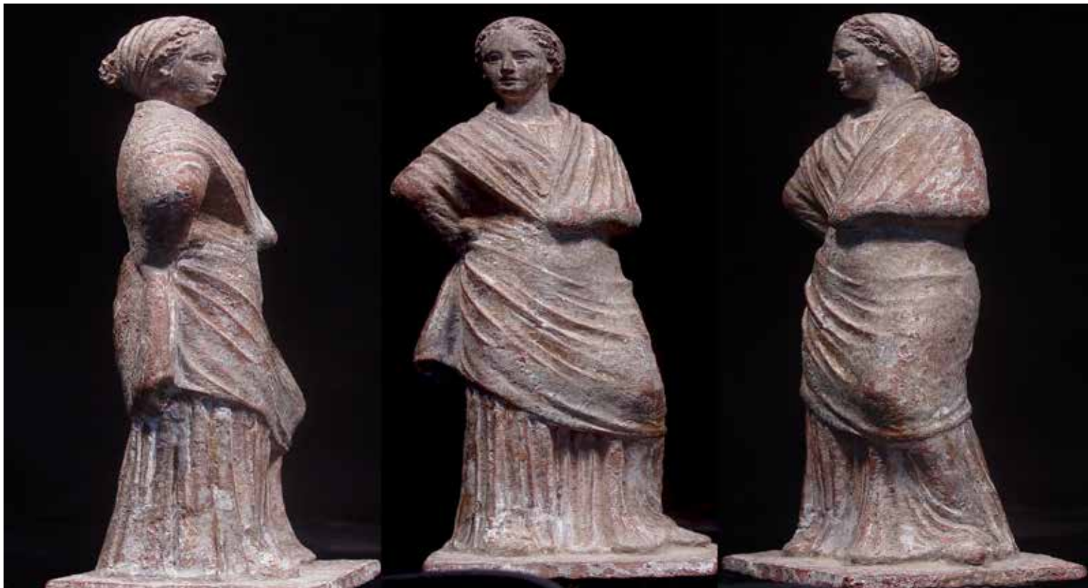
تندیس زن آتنی در یونان باستان

اما در بخش های مختلف یونان این اتفاق در یک زمان و به یک شیوه رخ نداده است. مثلا همزمان با این که در بخش هایی مثل آتن که دیگر دستخوش این تغییرات شده بود، هنوز در بخش هایی هم چون اسپارت مقاومت از سوی زنان در مقابل به حاشیه و انزوا برده شدن به چشم می خورد. در آتن اندرونی ها شکل گرفته اند، زنان از جامعه، دیگر می توان گفت به طور کامل حذف شده اند، تحصیل تنها به واسطه ی دایه، در خانه و تا درجه ی محدودی صورت می گیرد و بر سر خطر عدم کنترل هوش زنانه صحبت می شود. در اسپارت اما وضع به گونه ای دیگر است. زنان در اسپارت تا مقاطع هم طراز با مردان تحصیل می کنند، جنگ جویانی متبحر و