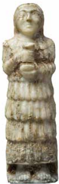
تمدن سومر، ۲۳۰۰ تا ۲۷۰۰ پیش از میلاد