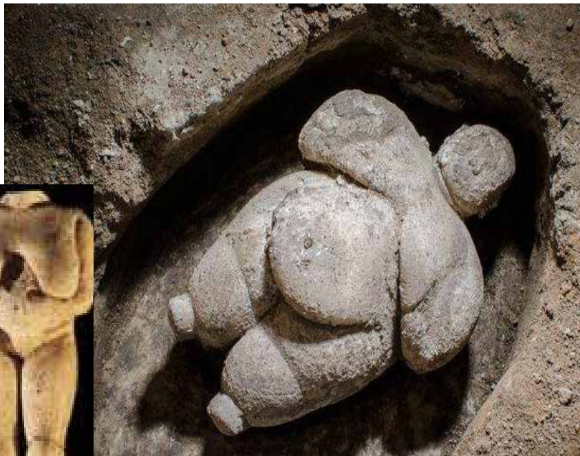
مجسمه ی ونوس، دوران نوسنگی، تمدن چاتال هویوک، ترکیه