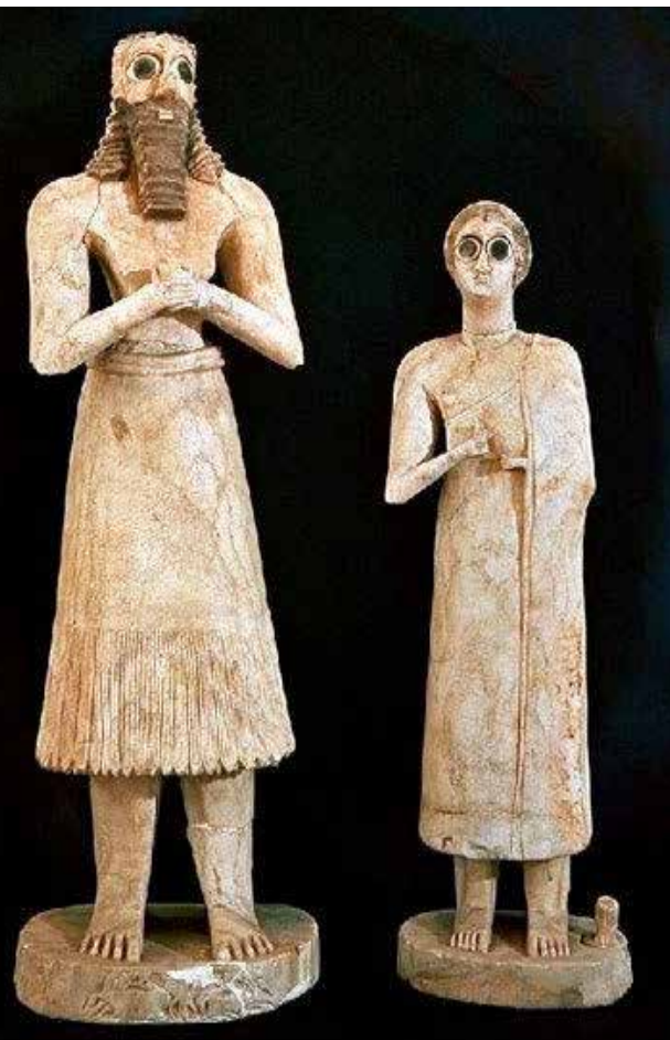
زن و مرد نیایشگر سومری «همان گونه که می‌بینیم، اختلاف چندانی میان لباس زن و مرد وجود ندارد»