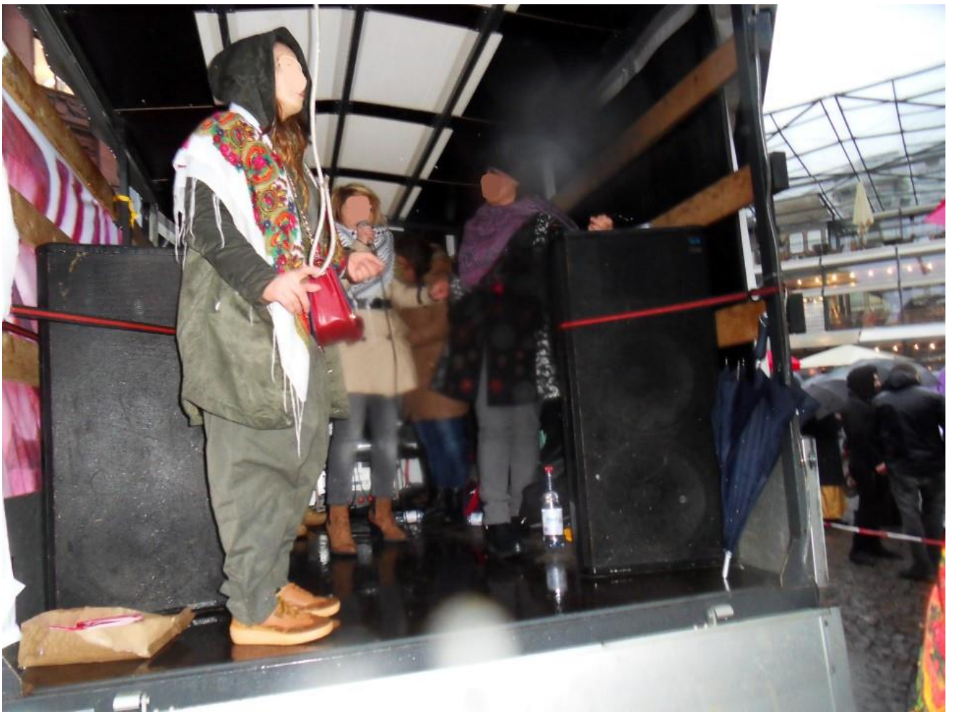
کارزار علیه خشونت دولتی، اجتماعی و خانگی بر زنان در ایران - شهر برمن سازمان زنان 8 مارس ( ایران-افغانستان) واحد برمن