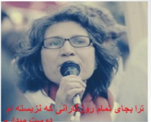
ترا بخاطر دوست داشتن دوست میدارم

سازمان زنان ۸ مارس از زمان تاسیسش توانست زنان بسیاری از هر طیف سیاسی و از هر ملیتی را حول خود جمع کند و نگرش و شناخت درستی از زاویه شناخت از خود و ستمی که بر آنها می رود را به آنها بدهد. آذر به عنوان یکی از مسئولین اصلی این سازمان نقش مهم و تاثیرگذاری در این زمینه داشت. رمز موفقیت او تئوریهایی بود که در این رابطه داشت که به شکل ماتریالیستی و واقعی جامعه آینده زنان را برای آنها ترسیم می کرد و از آن مهمتر نقش زنان در پدید آوردن این جامعه را به آنها نشان داد و به معنای واقعی نشان داد که جنبش زنان موتور جنبش کمونیستی است و بدون حضور زنان هیچ انقلابی رخ نخواهد داد. آذر درخشان یک زن انقلابی، کمونیست و یک مارکسیست فمینیست به معنای واقعی بود. فعالیت متشکل او در حزب کمونیست ایران (م-ل-م) و