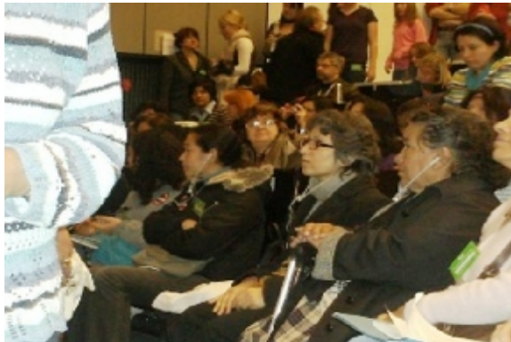
جمهوری اسلامی را خواهد کوبید.»

« از طرف «گروه مانیفست کمونیزم انقلابی» (در اروپا) پیام به مناسبت درگذشت رفیق آذر